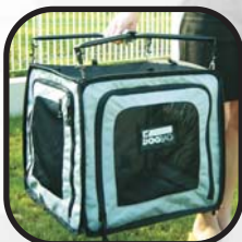
Carry Set CS XS