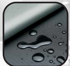
HDF [Heavy Duty Fabric]