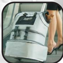
Lower Bag [porta-todo]