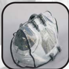
Rain Cover [anti-lluvia]